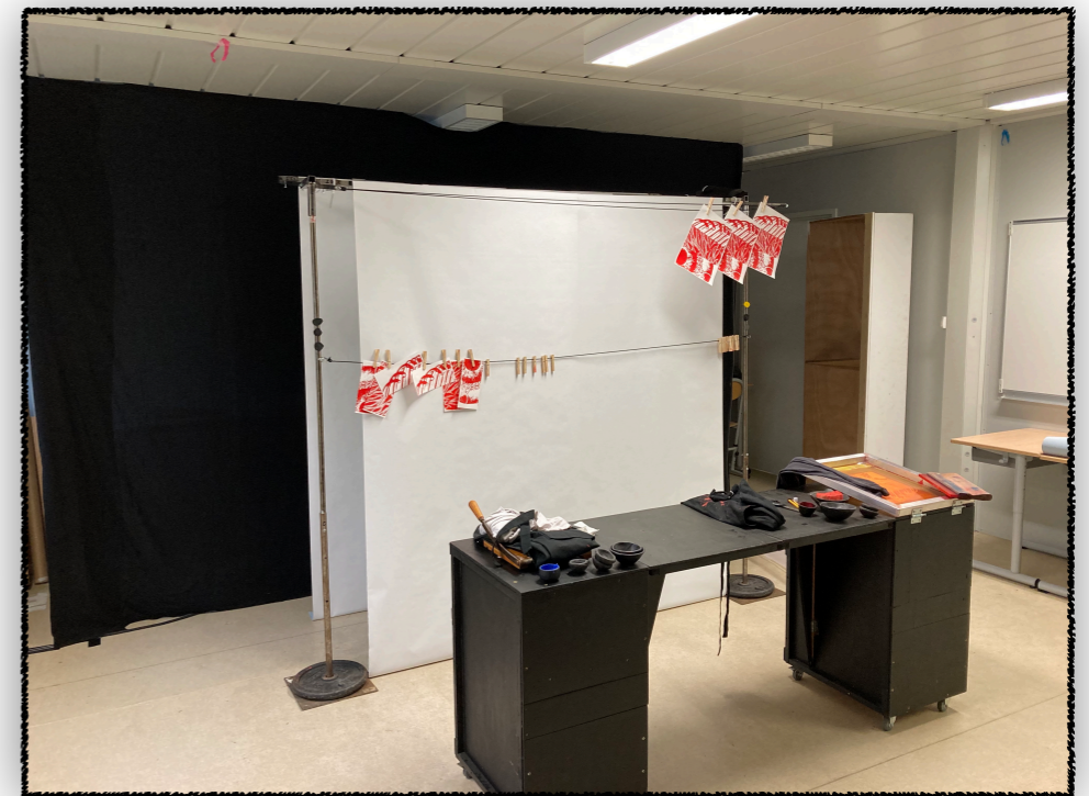
Scénographie de l'espace-jeu (coté scène)